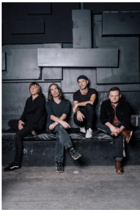
Headliner in der JVA: Selig.